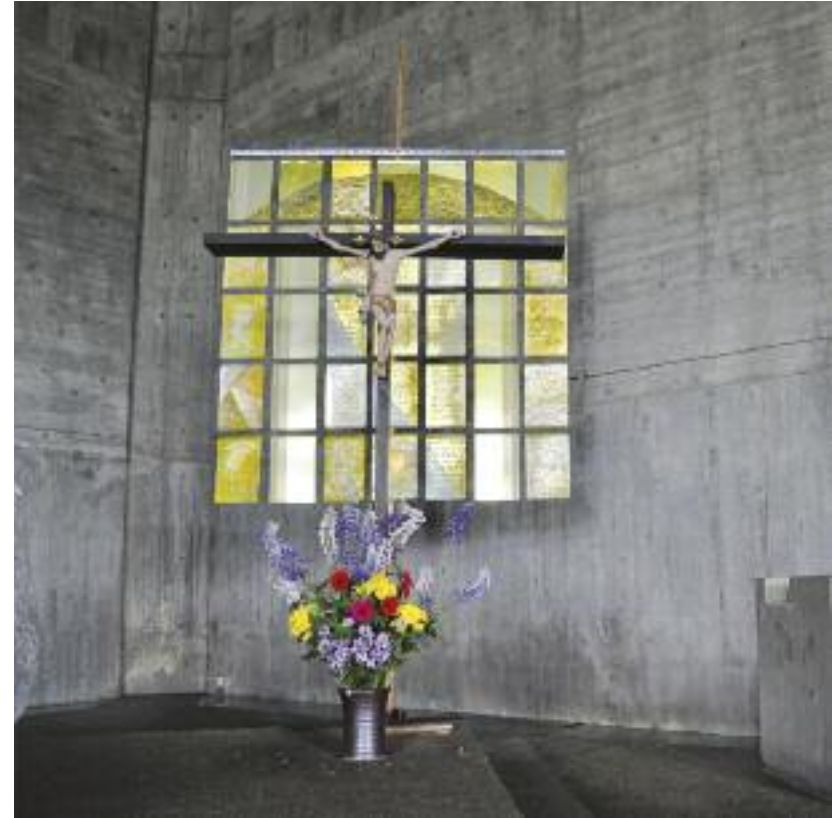
Lilo Maisch Die Verklärung Christi auf dem Berge Tabor Bildinstallation: 35 Metallplatten, Acryl, Sand, 200 x 200 cm

Seit geraumer Zeit arbeitet Lilo Maisch mit gebrauchten Offsetplatten, die sie mit Acrylfarben, Kunstharzfarben und Sand bemalt. Dabei ist es für sie essentiell, dass der metallische Untergrund der Platten im Bild mit zur Sprache kommt. Die auf manchen Tafeln verwendete Winkelschrift verrät die Texte in eine unleserliche Schrift, einem Code gleich, dessen Bedeutung nur dem Eingeweihten zugänglich ist.