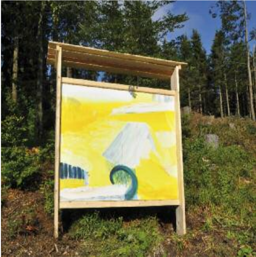
Susanne Zuehlke Ausblick 2014, Eitempera Holz

Der lichtdurchflutete Landschaftsraum nimmt bei Susanne Zühlkes Werk Ausblick formale Aspekte ihrer Umgebung am Feldberg auf. Ein Heuschaber, ein Zaun, eine Anhöhe sind Versatzstücke aus der dinglichen Welt, die den sehr offen gedachten Bildraum zwar nicht zu verorten vermögen aber doch mit dem Umraum verknüpfen. Deutlich ist im Vordergrund eine offene Kreisform grün-schwarz als Zäsur gesetzt. Diese abstrakte Form verbindet nicht nur beide Bildtafeln miteinander, sie bildet ein Zentrum und erdet in gewisser Weise die luftige, schwebende Komposition und ist ihr komplementär zugeordnet. Zuehlkes Landschaftsraum befindet sich in einer atmosphärischen Auflösung von lichten gelben und weißen Farbwolken, der eine Gleichzeitigkeit von verschiedenen Perspektiven erzeugt, ein festgelegtes Oben und Unten ist nahezu aufgegeben. Sie zwingt uns, die gewohnten Parameter eines eindeutigen Betrachterstandortes aufzugeben.