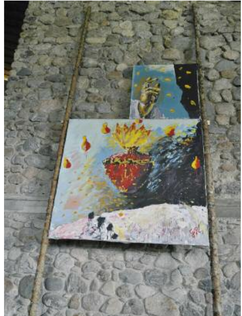
Günter Reichenbach Pfingsten Leimfarbe auf Nessel, ca. 310 x 190 cm

Günter Reichenbach formuliert dieses Pfingstwunder in seiner zweiseitigen Arbeit mit erzählerischem Schwung und sinnlich überbordender Malerei. In der oberen Bildtafel ist eine auratische (göttliche) Hand zu sehen, die mit Schwung kleine, gelbe Glutbällchen nach unten wirft. In der unteren Tafel sind die Gluttropfen größer und rotleuchtend. Sie tummeln sich um ein gewaltiges, schwebendes, brennendes Herz; emblematisch ein Symbol für die Liebe zu Gott. Die schwungvolle Malerei formuliert einen Bildraum, der ganz aus den pastos gesetzten Farbflächen herausgearbeitet ist. Rhythmisch gesetzte Farbkommata und saftige Farbschlieren künden von einer impulsiven Malfreude, die trotz der Verwendung einzelner erkennbarer Bildgegenstände (Hand, Herz) reine Malerei sein will. Die Freiheit der Malerei beinhaltet für Reichenbach, wie im Übrigen auch für viele andere an der Ausstellung teilnehmenden Künstler, die Möglichkeit, sich für Themen und Motive zu entscheiden, die als überwunden oder veraltet galten. In der Überwindung des Tradierten entsteht hier mit Frische und Verve ein offenes Bildgefüge, das sich trotz der motivischen Nachvollziehbarkeit, scheinbar mühelos neu erfindet.