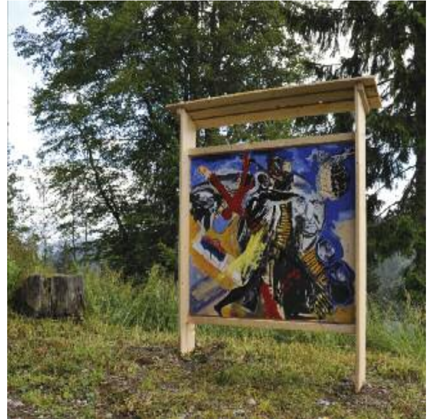
Stefan W. Kunze Der Berg 2014, Ölfarbe, Tempera, Collage auf Holz

Der Sisyphos an Stefan Kunzes Berg rollt erklärtermaßen nicht nur Steine, sondern auch Köpfe. Er räumt auf am Berg der Geschichte, an dem Unheilvolles sich ereignet. Ein Gekreuzigter stürzt von oben herab, ebenso Himmelskörper, Flugzeuge, Bomben. Die disparate Welt, die Geschwindigkeit, allgegenwärtige Kommunikativität über allem propagiert und die Freiheit als eine Subversion des kleinen Mannes disqualifiziert, ist aus den Fugen geraten. Ein erlösender Silberstreif am Horizont ist dank des Sisyphos-Motivs nicht erkennbar- oder doch? Links im Bild ist als Zeichen bodenständiger Unversehrtheit ein für den Feldberg typisches Fachwerkhaus zu sehen, ein Baustein für Kunzes Archiv Heimat?