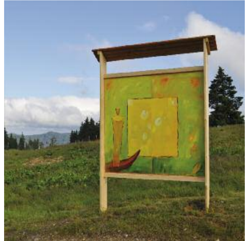
Brigitte Sommer Gelber Garten 2014, Acryl, Lack auf Holz

In der Bildwelt Brigitte Sommers wird dieser Garten bewacht durch eine in einem Nachen stehende Wächterfigur, die etwas anachronistisch wirkt und an Bildvorstellungen des Fährmanns Charon denken lässt, der in der griechischen Mythologie die Toten über den Fluss Acheron zum Eingang des Hades brachte. Für diese Figuren, die ein immer wiederkehrender Bestandteil der Bildwelt von Brigitte Sommer sind, gibt es keinerlei Vorbilder, sie entstehen im Zusammenhang mit dem Malprozess vollkommen frei und immer wieder neu.