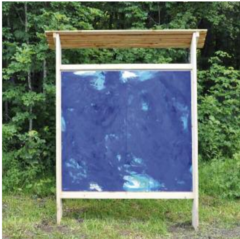
Sandro Vadim o. T. 2014, Acrylbinder/ Pigmente auf Sperrholz

Das Bild ohne Titel wird an seinem Standort hinterfangen von einer dichten, grünen Blätterwand. Der tiefblau oszillierende Bildraum, der aus mehreren durchlichteten Sphären zu bestehen scheint, zieht den Blick tief hinein in kühle, rätselhafte Tiefen. Viele Schichten und Farbhäute sind hier in einem langen Malprozess konzentriert übereinander gelegt worden, um den Bildraum gänzlich mit transparenten Farbwolken zu komponieren. Und hier schöpft Sandro Vadim aus dem Vollen: er moduliert weich, schmeichelnd, schwingend, innehaltend ruhend, an anderer Stelle wird der Pinselstrich heftig, schwingt rhythmisch, dynamisch, schnell und pflügt durch die Farbe. Die lasierende Maltechnik suggeriert Atmosphäre, die entfernt an Seherfahrungen in der Natur denken lassen. Als abstrakte Erinnerung an das Wesen einer Landschaft, die Hitze, die Kälte, Emotionen, Befindlichkeiten und vor allem das ständig sich verändernde Licht!