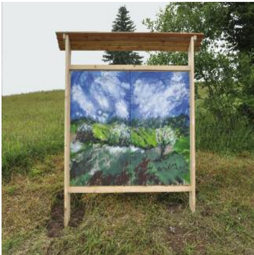
Gabriele Goerke Wolkenfrühling 2014, Acrylbinder/Pigmente auf Sperrholz

Gabriele Goerkes Bildraum erscheint auf den ersten Blick wie ein Fenster in die Landschaft hinein. Im Wolkenfrühling manifestiert sich etwas aus dem Erfahrungsbereich von Natur, das hier ungehindert Eingang findet in die Kunst. Blütenreiche Bäume sind hier in einem tiefenräumlich angelegten Landschaftsausschnitt zu sehen. Sie stehen vor einer saftig grünen Landschaft, die im Bildhintergrund durch eine Bergkette hinterfangen wird. Wild wogende, weiße Wolkenfetzen steigen in den Himmel auf und verbinden die erdige Wiesenfläche mit dem strahlend blauen Himmel.