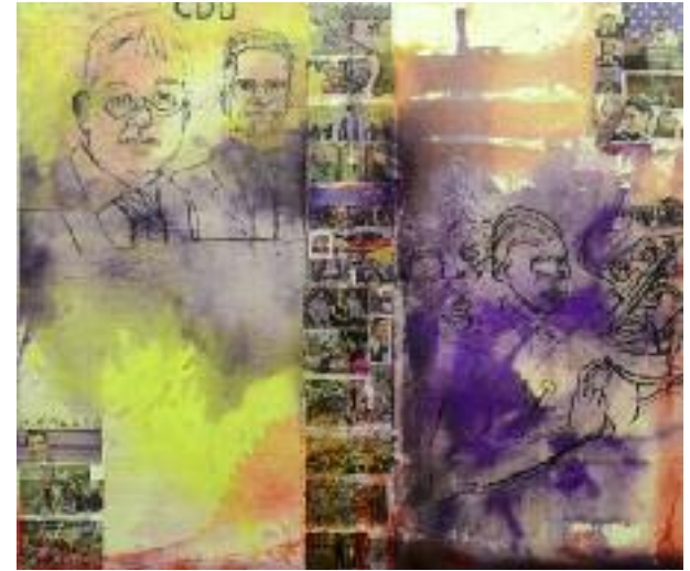
Harald Kille Pfingsten , Kiew, Ukraine 2014. Pastell, Kohle, Tempera

Das freigesetzte Feuer frisst sich farblich und bildlich bis auf die Rückseite des Bildes durch, das mit dem Titel Das ist alles weit weg die Distanz thematisiert, die sich bei nicht direkt Betroffenen einstellt. Die indirekte Wahrnehmung über Nachrichten-Medien in örtlicher Entfernung zu dem Geschehen lässt die Menschen auch innerlich auf Abstand gehen. Die internationalen Krisenherde scheinen nichts mit unserem Lebensalltag zu tun zu haben. In Killes Bild stehen Politiker scheinbar untätig diesen Krisenherden gegenüber. Auch die Konfrontation mit Bildern von Flüchtlingsströmen, die sich mehr und mehr über Europa ergießen, haben noch keine staatenübergreifenden Reaktionen erwirkt. Kille kritisiert in seinem Werk den Mangel an der christlichen Caritas (der Nächstenliebe) und der Verantwortung, die die Menschen anderen gegenüber zumindest als politisch Verantwortliche übernehmen sollten. Das Bild ist bei Kille inhaltlich aufgeladen und wird mit seiner ausdrucksstarken Bildsprache zum Instrument der Gesellschaftskritik.