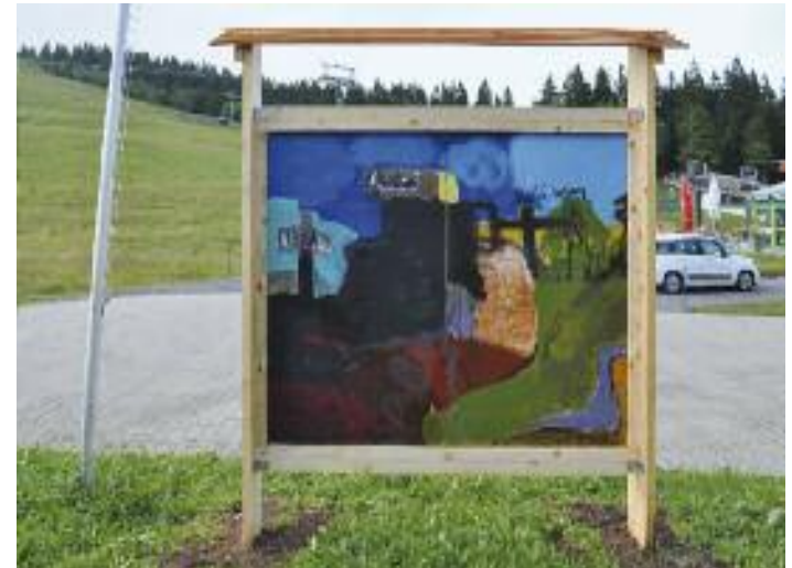
Jürgen Wiesner Glaube Liebe Hoffnung 2014, Acryl, Collage auf Sperrholz