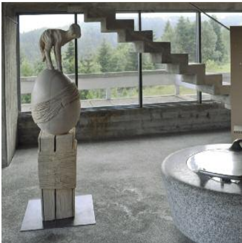
Michael Steigerwald Buch Ei Lamm 2009, Linde, weiß lasiert auf Eisenplatte, 176 x 50 x 40 cm

Michael Steigerwald bleibt mit seiner Holzarbeit Buch, Ei, Lamm motivisch in der überlieferten Bildsprache religiöser Kunst. Er macht sich somit die bekannte Ikonografie der drei Motive zunutze, um seine Inhalte zu transportieren. Das Buch steht für die Bibel, das Buch der Bücher , das im Alten Testament verkündet, was sich im Neuen Testament mit dem Erscheinen und Wirken des Gottessohnes erfüllen soll. Das ist sozusagen die Grundlage der christlichen Lehre und folgerichtig baut sich das Objekt auf dieses Buch auf. Auf dem Buchobjekt balanciert ein aufrecht stehendes Ei, das sowohl als Fruchtbarkeitssymbol zu verstehen ist, aber auch als Symbol für den Neubeginn durch die bevorstehende Geburt steht. Der Standort des Objekts in der Nähe des Taufbeckens nimmt in diesem Zusammenhang einen nachvollziehbaren Bezug zum Kirchenraum auf. Es verweist auf die Geburt Jesu und mit ihm auf den Beginn einer neuen Zeitrechnung, einer neuen Weltsicht. Das alttestamentarische Credo Auge um Auge wird durch Jesus in einen Glauben des Friedens, der Gewaltlosigkeit und der Nächstenliebe überführt. Im Lamm, das auf dem Ei thront, ist der Opfertod von Jesus symbolisiert, der nach christlichem Glauben als Sühnetod für die Erlösung der Menschen von ihren Sünden steht. Das Lamm Gottes, das nach dem Glaubensbekenntnis die Sünden der Welt hinweg nimmt.