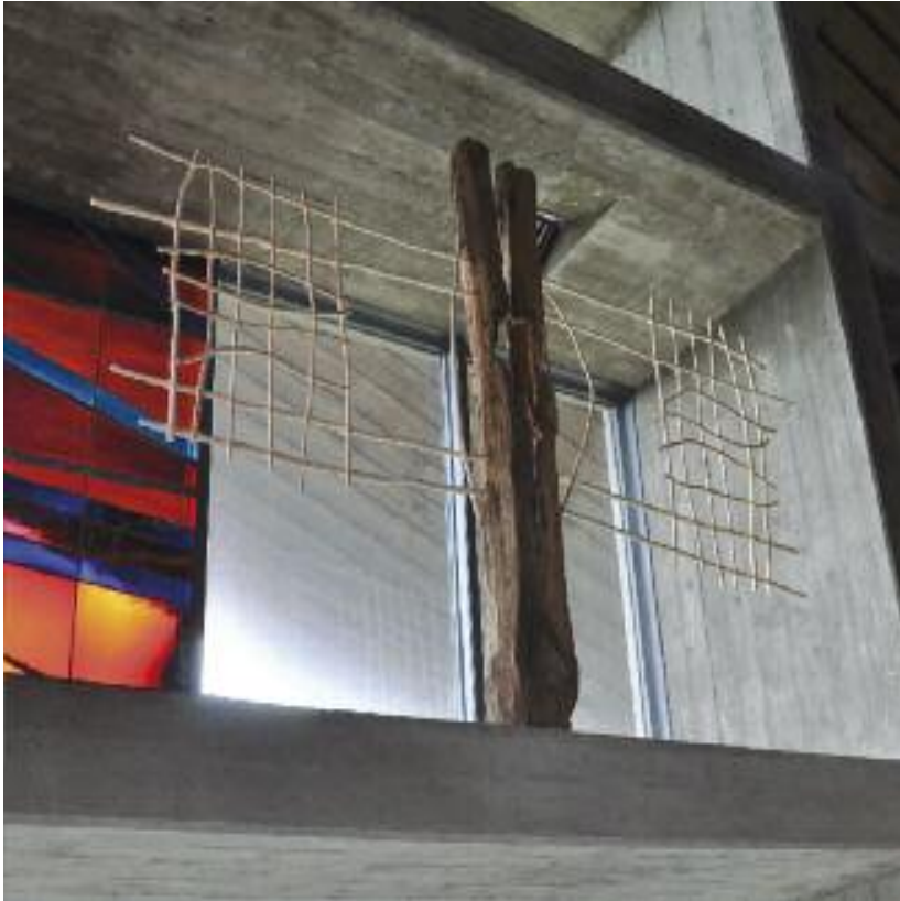
Peter Klein Gipfelkreuz Alter Eichenholzbalken und Haselnussruten, 210 x 285 cm

Das Gipfelkreuz von Peter Klein holt die Idee des Berges in die Kirche und schafft so eine Symbiose von Innen- und Außenraum. Der Kreuzbalken ist aufgebrochen und stark verwittert, er ist den Zeitläuften ausgeliefert. Die Kreuzarme, aus Haselnussruten geflochten, öffnen das Kreuz und lassen den Durchblick zu auf die Weite des dahinter liegenden Himmels. Der erhöhte Standort in dem Fensterband unterstützt auf sinnfällige Weise die Idee des Gipfelkreuzes und verweist auf die wenigen farbigen Schmuckelemente der Kirche; in diesem Fall auf das glutrote Glasfenster, das die farbsymbolisch aufgeladene Bühne für das Kreuz bildet. Leid, Tod und Auferstehung werden durch diese Licht- und Kreuzmetaphern thematisiert.