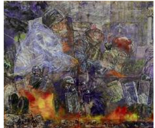
Pfingsten , Das ist alles weit weg 2014, Kohle, Tempera, Collage