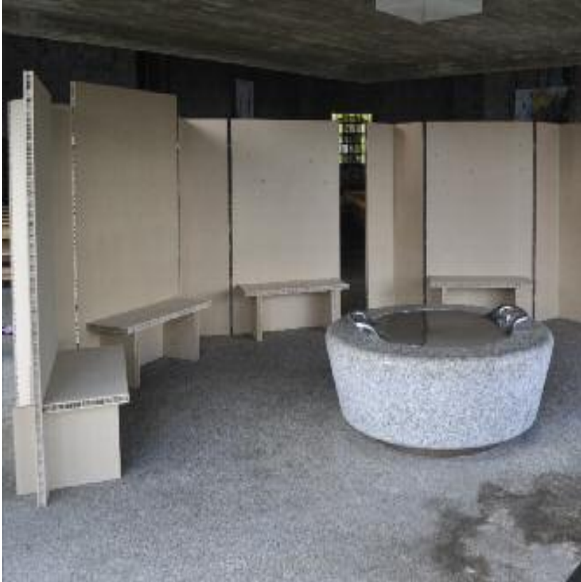
Hildegard Strutz Außen – Innen, Innen – Außen architektonische Rauminstallation, Eurolightplatten, Span und Pappe ca. 350 x 600 x 180 cm

Mit dem Slogan Kirche klappt wirbt Hildegard Strutz auf ihrer homepage für das moderne Konzept einer mobilen Kirche, sowie für temporäre, sakrale Räume. Mittels eines flexiblen, variablen Modulsystems, das sich leicht handhaben lässt, hat sie in der Feldbergkirche rund um das Taufbecken – einem Baptisterium gleich – einen Kappellenraum entstehen lassen. Er befindet sich in der Nähe des Fürbittenbuches, das neben dem Eingang für die Kirchenbesucher bereit liegt. Gelangt man in diesen kleinen Kapellenraum, ist man plötzlich ganz bei sich. Die Geräusche des Kirchenraums sind gedämpfter und man wird von angenehm geschwungenen Wänden umfassen. In den Wänden stecken in runden Öffnungen kleine zusammengerollte Zettel. Hier nimmt die Künstlerin Bezug zu dem Fürbittebuch auf und gibt ergänzend zu diesem, den Besuchern die Gelegenheit, Fürbitten, Gedanken, Wünsche und anderes in die Wand zu versenken, mit dem Wunsch auf göttlichen Beistand bei der Erfüllung des Gewünschten oder Erhofften. Hildegard Strutz hat hier mit sehr einfachen, reduzierten klaren Elementen einen atmosphärisch sehr dichten Raum im Raum geschaffen, der das ermöglicht, was die Kirche den Gläubigen traditionell anbietet: einen Raum für das stille Gebet, zur Meditation, zum ruhigen Nachdenken. Kunst stellt sich hier den Aufgaben der Kirche und entwickelt eine zeitgenössische, moderne Antwort.