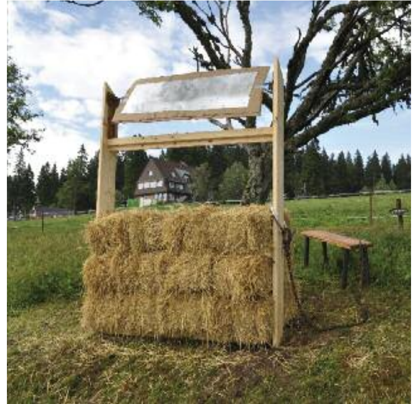
Renate Koch Von Geschichten vom Berg 2014, Stahl, Holz, Stroh, Karton, Druckplatten

Von Geschichten vom Berg öffnet mit ihrem archaisch anmutenden Vokabular eine Tür in unser Unterbewusstsein. Dort rührt sie an Erinnerungen von Gerüchen und Bedingungen eines ursprünglichen Lebens in der Natur mit seinen Geschichten, Sagen, Gestalten und Mythen.