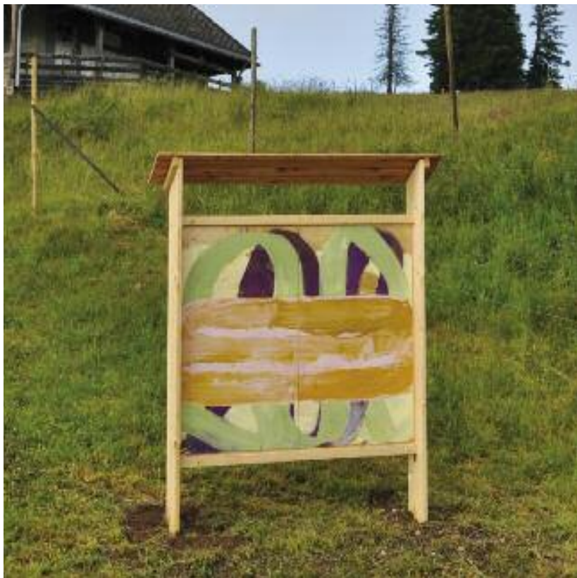
Heinz Thielen Kurven 2014, Pigmente und Acryl auf Holz

Die pastos gesetzten Kurven von Heinz Thielen stehen dicht am Straßenrand und konfrontieren den vorbeiziehenden Verkehr mit einer in sich ruhenden, geschlossenen entschleunigten ovalen Form, die darunterliegende Kurvenformationen zu bändigen scheint.