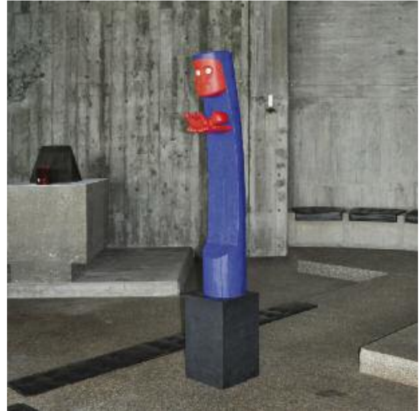
Franz Gutmann Madonna Lindenholz mit Acryl blau und rot bemalt, 142 x 29 x 33 cm

Die Madonna mit Kind ist ein tradierter Figurentypus im Sakralraum, der hier von Franz Gutmann aus klassischem Lindenholz gefertigt und, wie viele mittelalterliche Madonnenfiguren vor ihr, auch farbig in blau und rot gefasst wurde. In romanisch anmutender, statuarischer Strenge tritt sie dem Kirchenbesucher neben dem Altar entgegen. Damit sind die formalen Bezüge zu dem tradierten Typus genannt, jedoch die Wirkung ist eine ganz andere. Die Leuchtkraft der expressiven Farbigkeit steht in entscheidendem Kontrast zur maskenhaften Abstraktion der sonst so lieblich gestalteten Marienfigur. Einer Totemfigur gleich mit rotem Gesicht und weit aufgerissenen Augen zwingt uns die Gutmannsche Madonna, über den Typus der Maria nachzudenken. Man gewahrt in ihren Händen das ebenfalls rot bemalte Jesuskind. Es hat den Mund und die Augen weit aufgerissen und die Hände zu Fäusten geballt. Hier wird nicht das selig lächelnde, göttliche Jesuskind vorgestellt, sondern ein wohl im Schrei verharrendes Kleinkind, das gleichwohl von einer gelassenen Mutter Gottes den Gläubigen in seinem Menschsein präsentiert wird. Im dialektischem Aufbau erweitert Gutmann die Bildwerktradition um Expressivität, Reduktion und Verdichtung auf einen konzentrierten Ausdruck.