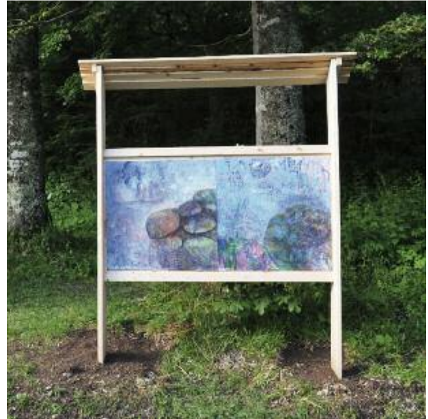
Roland Spieth Steine, Berg 2014, Ölkreide und Acryl auf Holz

Michael Hübl bemerkte zu Spieths Malerei: Die Kunst nähert sich der Natur an: Sie wird nicht gemacht, sie entsteht. Damit ist der Vorgang klar. Formen nähern sich während des Malvorgangs im Zusammenspiel mit einer Farbgebung, die für den Naturraum noch plausibel scheint, immer stärker Motiven aus dem Kontext Natur und Landschaft an und legen sich fest. Sie werden zu einer lesbaren Struktur, aus schwebenden Farbwolken wird ein Himmel, aus runden gefassten Formen Steine, manches bleibt offen und wird dem sich in die Bildwirklichkeit vertieften Schauenden und seinen Seherfahrungen überlassen.