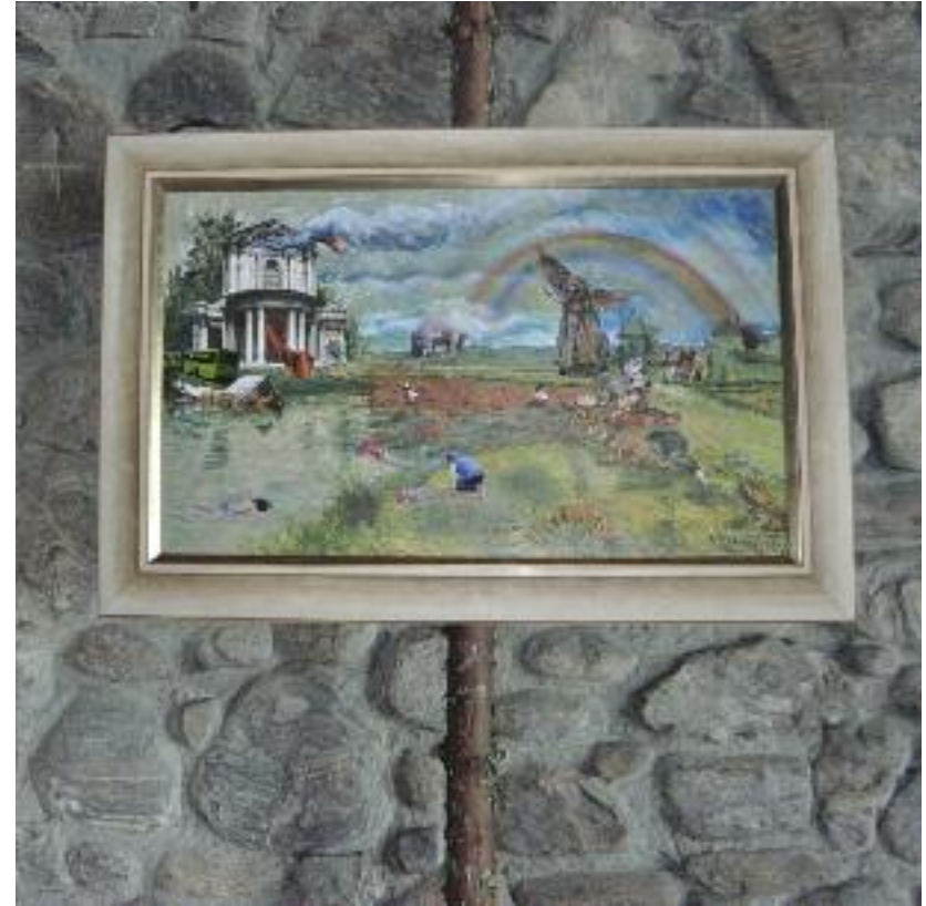
Martin Warnke Der fünfte Stand 2014, Collage auf gerahmter Reproduktion eines Gemäldes von Camille Pissarro, Fotografien, Tusche, Aquarell, Bleistift, 75 x 110 cm

Die drohende Apokalypse liegt diesem Bild wie eine lauernde Gefahr zugrunde. Die collagierten Elemente sind wie ein Sampling der Wirklichkeit ins Bildgeschehen montiert. Sie zeigen die Gleichzeitigkeit unheilverkündender Motive und Geschehnisse, wie wir sie vielleicht aus den täglichen Nachrichten und Reportagen zwar kennen und wahrnehmen, aber nicht in Zusammenhang bringen und deshalb die globale Gefahr darin nicht erkennen. Warnkes Arbeit fordert uns, die Betrachter, zum Ikonolog auf: zum Nachdenken über die Bedeutung der Bilder innerhalb und außerhalb der Kunst.